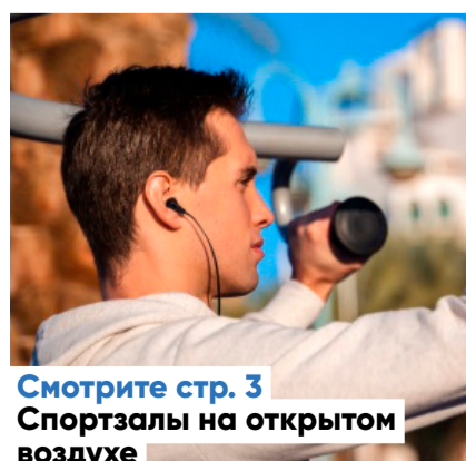
Смотрите стр. 3 Спортзалы на открытом воздухе