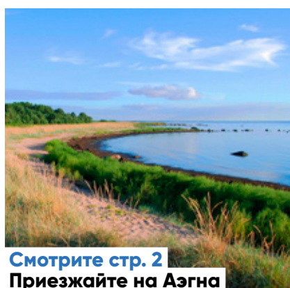
Смотрите стр. 2 Приезжайте на Аэгна

Таллинн привлекает полтысячи велосипедистов, чтобы картографировать передвижение на велосипедах, призывая участвовать в международном исследовании мобильности. В ходе исследования, которое продлится с июня по сентябрь, будут картографированы маршруты движения велосипедистов. Собранные данные дадут возможность более основательно проанализировать велосипедное движение и в дальнейшем, используя эти данные, улучшить удобство