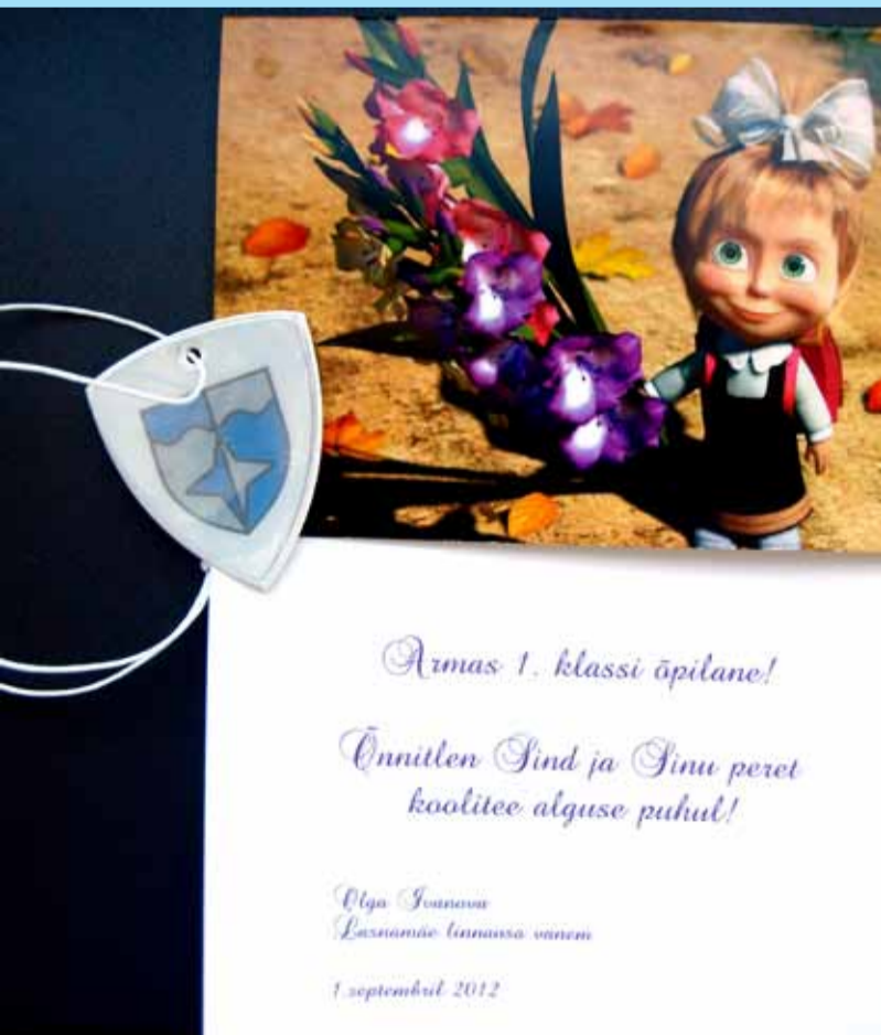
„õnnitluskaart ja helkur“