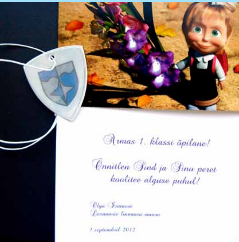
Поздравительная открытка и светоотражатель