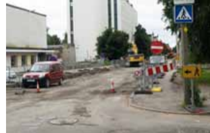
Ремонтные работы на улице Палласти

В районе Лаагна реновируются Калевипоя пыйк, улицы Калевипоя, Вилкерлазе и М.Хярма.