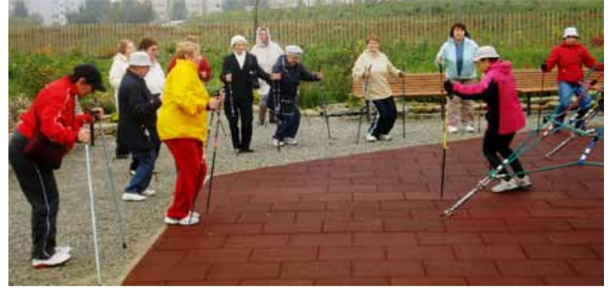
Фото: ходьба с палками

Ходьбу с палками поддерживает Благотворительная касса в рамках программы «Профилактика травм в быту и в свободное время в Таллинне».