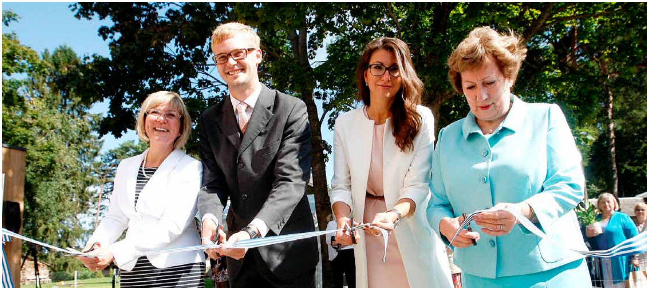
Торжественное разрезание ленточки: ножницы в руках вице-мэра Таллинна Эхи Вырк, представителя EAS Райнера Аавика, старейшины Ласнамяэ Ольги Ивановой, вице-мэра Таллинна Мерике Мартинсон