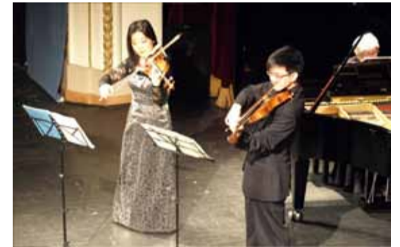
Концерт классической музыки в исполнении выдающихся французских музыкантов собрал полный зал в Центре Русской Культуры.