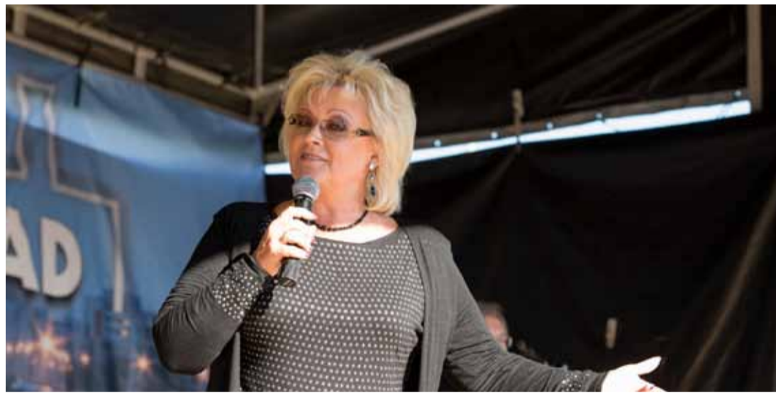
Концерт знаменитой Анне Вески, завершивший программу Дней Ласнамяэ, собрал сотни человек на площадке возле Линдакиви!

XIX Дни Ласнамяэ уже стали историей, но есть возможность вспомнить интересные моменты, мероприятия, события – все то, что произошло с 15 по 20 мая.