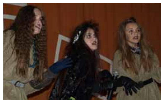
Мюзикл «Однажды, в одном городе» стал украшением театрального фестиваля «Играем в театр», который прошел в Линнамяэском русском лицее.