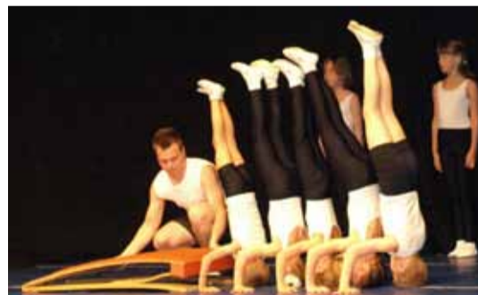
Как всегда на высоте, в прямом и в переносном смысле этого слова, были коллективы Культурного центра Линдакиви.