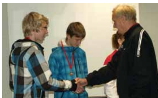
Победителей соревнования по ориентированию поправлял и вручал медали и кубки олимпийский чемпион 1972 года по прыжкам в высоту Юри Тармак.