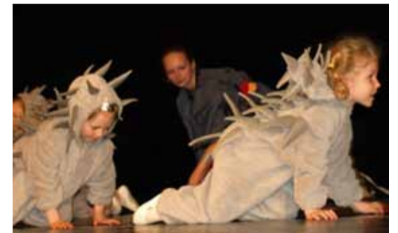
В среду, 16 мая, на сцену Линдакиви вышли самые маленькие артисты нашего района – те, кто еще ходит в детские садики. Самому маленькому участнику, исполнявшему танец ежика, было всего два годика!