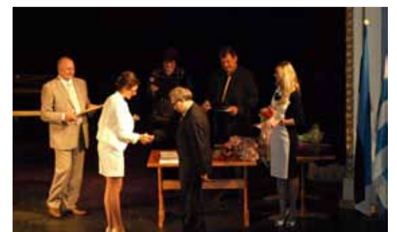
Памятные знаки Ласнамяэ получили те, кто многое сделал и делает для того, чтобы наш район становился из года в год только лучше.