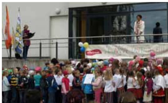
Мини-певческий праздник состоялся на площадке возле Культурного центра Линдакиви. Причем мини он был не по количеству участников, а потому, что возраст тех, кто исполнял самые разные песни, был от трех до семи лет.