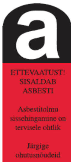
Joonis 14. Materjali asbestisisaldusest teatav hoiatusmärk (Vabariigi Valitsuse 11. oktoobri 2007. a määrus nr 224, lisa 2)

Asbestijäätmeid tuleb käidelda ja ladestada, järgides asbesti sisaldavate jäätmete kohta kehtestatud käitlusnõudeid ning nendega seonduvaid õigusakte.