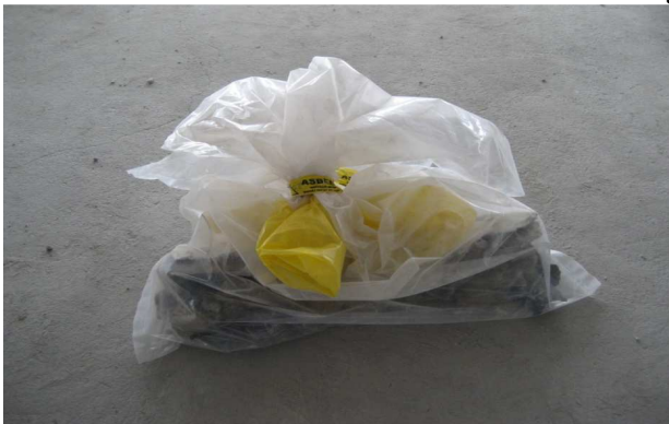
Joonis 12. Kinnaskott asbestijäätmetega

Tööjuhendid madala riskiga asbestitööde läbiviimiseks esitatakse lisadena (vt lisad 1–12)