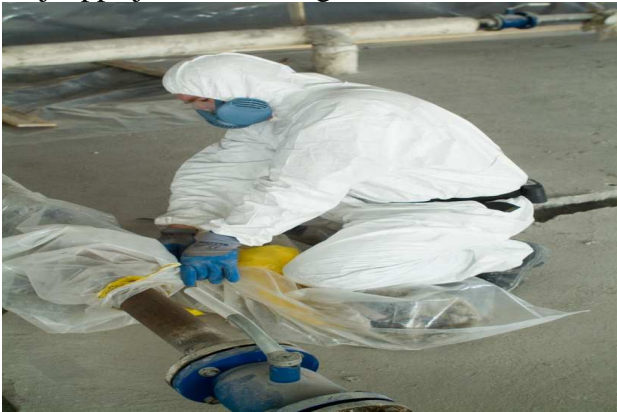
Joonis 11. Isolatsiooni eemaldamine kinnaskotiga

Kinnaskott on ühekordseks kasutuseks ettenähtud tugevast läbipaistvast kilest valmistatud kott, mis on varustatud töö läbiviimiseks vajalike kinnastega. Väljaspool kinnaskotti asuv töötaja, olles kinnitanud koti mahavõetava materjali ümber, saab selle eemaldada koti sisse avanevate kinnaste abil. Eemaldatud materjal kogutakse kinnaskoti alumisse ossa, seejärel kott suletakse tõmbesulguriga ja kõrvaldatakse koos jäätmetega (joonised 11–12). Kui on tegemist eriti rabeda materjaliga, tuleks kinnaskotti kasutada kerge alarõhu all (alarõhuline kinnas- e lammutuskott). Kinnaskotte on erineva suurusega. Optimaalne kinnaskott kasutamiseks ühele töötajale on mõõtmetega 1 × 1,5 m ning mahutab maksimaalselt kuni 60 kg asbestijäätmeid. Selle meetodi kasutamisel peab töötaja olema saanud vastava väljaõppe ja kandma hingamisteede kaitseks P3 filtriga maski (EN 149 FFP3).