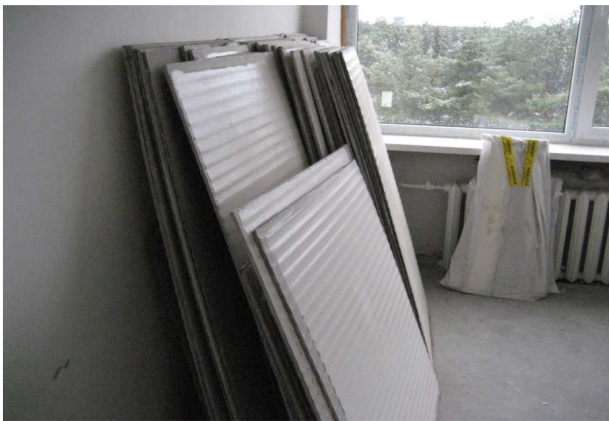
Joonis 13. Eemaldatud asbesttsementplaadid

Suured eemaldatud asbesttsementplaadid tuleb kõrvaldada töökohalt tervelt. Väiksemad tükid tuleb kokku korjata ja kottidesse pakkida. Kui materjal kotti ei mahu, võib selle pakkida polüetüleenkilesse (joonis 13).