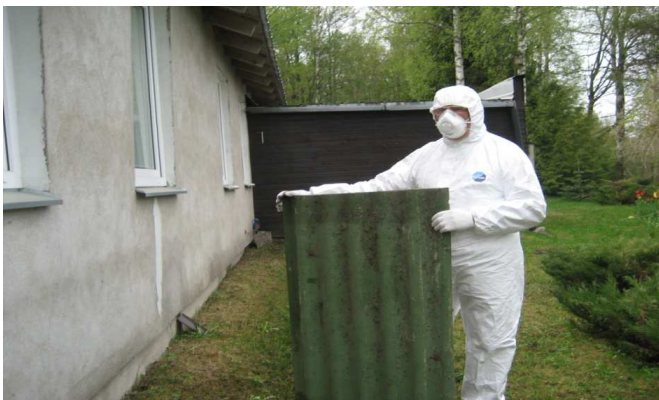
Joonis 8. Asbesttsementplaatide eemaldamine

Asbesttsementplaadid (nt katus, fassaad) tuleb lahti võtta ehitamisele vastupidises järjekorras ja eemaldada tervelt, vältides nende kahjustamist või purustumist (joonis 8). Enne plaadi kinnituskruvide või naelte eemaldamist tuleb need katta tihke pastaga. Tervelt tuleb eemaldada ehitistest ka soojustatud (mineraal- ja klaasvatt, penoplast) asbesttsementpaneelid.