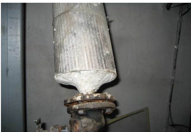
Joonis 9. Asbestseguga isoleeritud toru

Kui asbesti sisaldavat materjali on kasutatud väikestes kogustes, nt asbestsegu või -nõoriga isoleeritud alla 1 m pikkune toru, toruots või liitekoht (joonised 9–10), võib erandjuhul, eriti kui kaitseümbrise ehitamine pole võimalik, eemaldada selle kinnaskotiga.