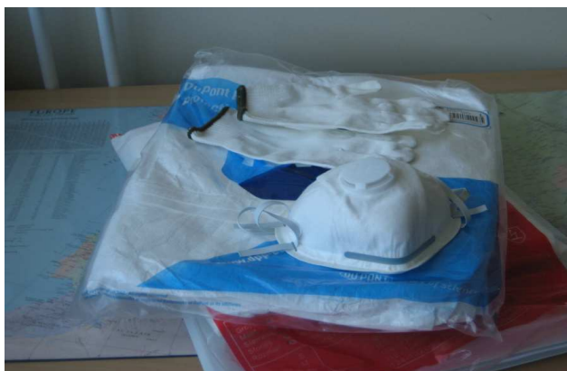
Joonis 2. Kaitsevahendid (kapuutsiga kombinesoon, kindad, mask P2S )