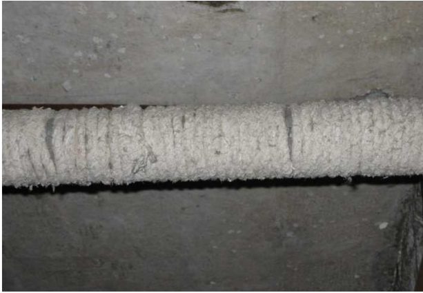
Joonis 10. Asbestnööriga isoleeritud toru

Kinnaskott on ühekordseks kasutuseks ettenähtud tugevast läbipaistvast kilest valmistatud kott, mis on varustatud töö läbiviimiseks vajalike kinnastega. Väljaspool kinnaskotti asuv töötaja, olles kinnitanud koti mahavõetava materjali ümber, saab selle eemaldada koti sisse avanevate kinnaste abil. Eemaldatud materjal kogutakse kinnaskoti alumisse ossa, seejärel kott suletakse tõmbesulguriga ja kõrvaldatakse koos jäätmetega (joonised 11–12). Kui on tegemist eriti rabeda materjaliga, tuleks kinnaskotti kasutada kerge alarõhu all (alarõhuline kinnas- e lammutuskott). Kinnaskotte on erineva suurusega. Optimaalne kinnaskott kasutamiseks ühele töötajale on mõõtmetega 1 × 1,5 m ning mahutab maksimaalselt kuni 60 kg asbestijäätmeid. Selle meetodi kasutamisel peab töötaja olema saanud vastava väljaõppe ja kandma hingamisteede kaitseks P3 filtriga maski (EN 149 FFP3).