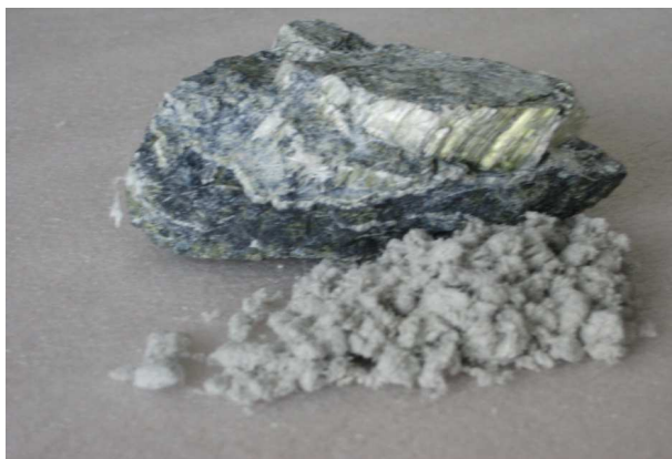
Joonis 1. Krüsotiilasbesti mineraal ja sellest eraldatud kiud

Asbest on kiuliste silikaatmineraalide üldnimetus. Meil on kasutatud põhiliselt krüsotiil- e valget asbesti, mis kuulub serpentiinide gruppi (joonis 1). Sõltuvalt leiukohast võib krüsotiilasbest sisaldada vähesel määral ka amfiboolasbestide gruppi kuuluvat tremoliiti. Need on põhilised asbestiliigid, millega võidakse meil kokku puutuda erinevate ehitiste ja lammutus-, renoveerimis- ja hooldustöödel. Eriotstarbeliste seadmete ja mitmesuguste sõidukite (nt laevad, rongid) hooldamise ja renoveerimise käigus võib kokku puutuda ka teiste amfiboolasbesti liikidega, nagu näiteks amosiit, kroküdoliit ja antofülliid.