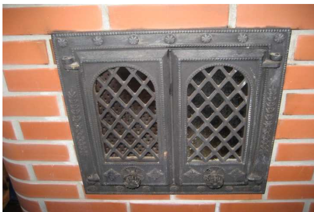
Joonis 7. Asbestnööriga isoleeritud ahjuuksed

Asbesti sisaldavate materjalidega võib kokku puutuda ka väikekatelde (standardküttekatlad võimsusega kuni 500 kW) ja korstende regulaarsel hooldamisel. Vanemates küttekateldes on kasutatud asbesti sisaldavaid lame- ja nõortihendeid. Nõortihendid on kõrge asbestisisaldusega (kuni 90%) ja neid kasutati katlauste tihendamiseks. Siin kasutatud kogused ei ole suured, kuid pikaajalisel kasutusel võivad nõortihendid muutuda rabedaks ja nende eemaldamisel või asendamisel tuleb kasutada kontrollitud töömeetodeid, et vältida või minimeerida asbestikiudude eraldumist töö- ja elukeskkonda. Ka koduses majapidamises kasutatavate pliidiplaatide ning tulekindlast klaasist ahjuuste tihenditena on kasutatud erineva jämedusega asbestnööre, mille eemaldamisel või asendamisel tuleb olla ettevaatlik ja vältida asbestikiudude sattumist eluruumidesse (joonis 7).