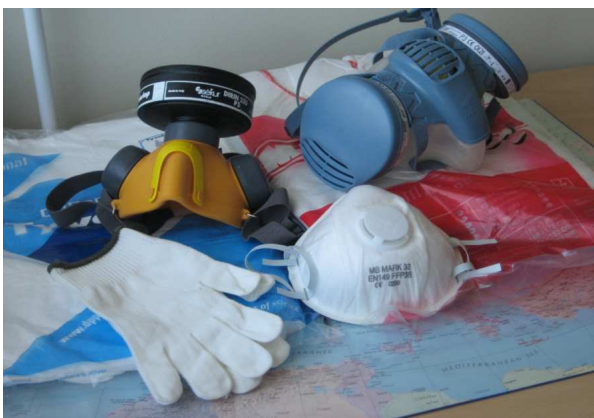
Joonis 3. Kaitsevahendid (kapuutsiga kombinesoonid, maskid P3S, kindad)

Isikukaitsevahenditel peab olema CE-märgistus, mis tähendab, et need on testitud Euroopa Liidu standardite kohaselt ning nende valimisel ja kasutamisel tuleb järgida nõudeid, mis on kehtestatud Vabariigi Valitsuse määrusega nr 12 (RT I 2000,4, 29).