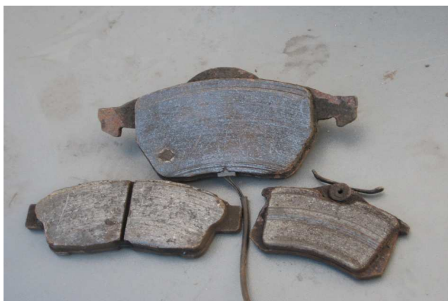
Joonis 6. Sõidukite friktsioonmaterjalid

seotud ning seega on tegemist tihke struktuuriga materjalidega. Mitmesugustes eriotstarbelistes seadmetes on kasutatud ka elastseid asbesti sisaldavaid hõõrdematerjale (nt asbestlindid).