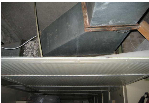
Joonis 4. Asbesttsement-poollaineplaatidest ripplagi

Asbesttsementtooted on enim kasutatud asbestmaterjalid ehituses. 1980. aastatel moodustasid need tooted ligi 4% kõigist kasutatud ehitusmaterjalidest. Tänu reale tuntud headele omadustele, milleks on vastupidavus, heli-, soojus- ja niiskuskindlus, kasutati neid tooteid laialdaselt nii sise- kui väliskonstruktsioonides. Meil aastatel 1963–1993 Kundas valmistatud portlandtsementist ja krüsootiilasbestist (10–15%) lainelisi asbesttsementplaate (eterniit) mõõtmetega 1200 × 686 mm ja 1750 × 1130 mm kasutati põhiliselt katuste katmiseks. Peale selle kasutati ehitistes ja mitmesugustes rajatistes veel asbesti sisaldavaid tasapinnalisi ja poollaineplaate (joonis 4) ning erineva läbimõõduga torutooteid, näiteks vee- ja kanalisatsioonitrasside, telefoni- ja sidekaablite paigaldamiseks.