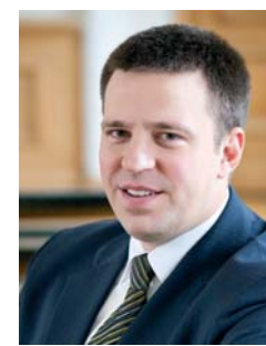
Юри Ратас, заместитель председателя Рийгикогу

Благодарю всех участников опроса и команду по его организации. Я обещаю, что мы очень серьезно отнесёмся к вашим отзывам и предложениям и будем работать во имя того, чтобы сделать Мустамяэ еще более приятным местом для жизни.