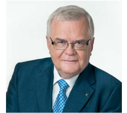
ЭДГАР САВИСААР мэр Таллинна

Декабрь – месяц предновогодний. Месяц, когда мы оглядываемся назад и строим планы на будущее. Праздники – время общения с близкими, воспоминаний об ушедших, время для попытки стать лучше, творить добрые дела, делая ли подарки или просто добрым словом. Я от души желаю всем таллинцам в новом году положительной заряженности и чувства единения!