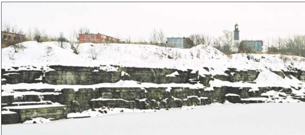
Lasnamäe Linnaosa Valitsus lammutas karjäärikalda hulgalt jubedaid metallgaraaže ja hoiab seda ala jõudumööda korras.