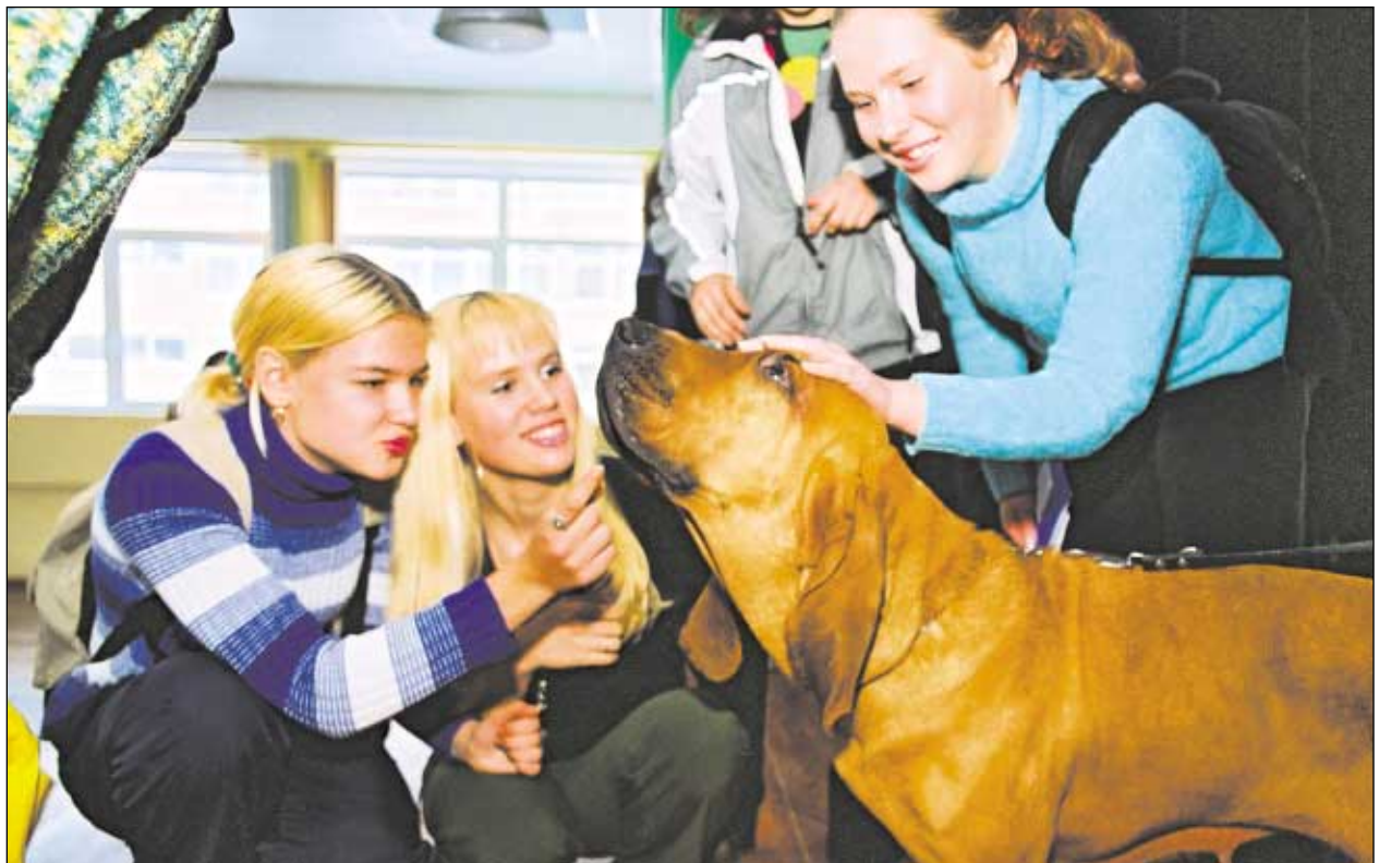
Lasnamäe Gümnaasiumi õpilaste lemmikuks politseipäeval kujunes narkoer.