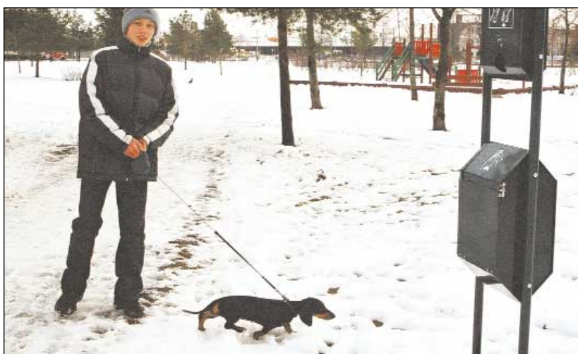
Selle taksi kaka pistis omanik piltniku nähes ruttu prügikasti.

Samas on mitmed linnaosavalitsuse töötajad tänavatel kuulnud elanike märkusi hooletutele koera-