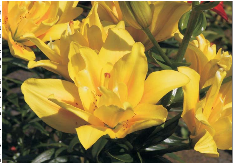
Liilia kultivar (lilium fata morgana)

komponente salvides ja plaastrites, mis aitasid põletushaavade ja teiste haavandite, ning arvati aitavat isegi pidalitõve, puhul. Taime lehti kasutati maohammustuste puhul. Liilia seemnetest valmistatud jook oli tõhus vastumürk maohammustuste ja seenemürgituse puhul. Liilia sibulatest valmistati arstimid konna silmade, sammaspoole, kõõma jms. vastu. Konna silmade raviks keedeti valge liilia sibulaid veinis ja lasti seejärel kolm päeva