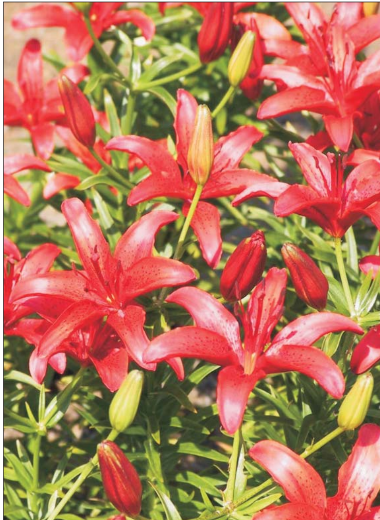
Liilia kultivar (lilium pepper)

Meie näitusel eksponeerivad liiliaid Epp Lepik (erakollektsionäär) ja Ave Visnapuu (TBA).